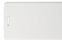
PC 102 Proximity Kart (125 kHz - ince tip, programlanabilir ve baskı yapılabilir)